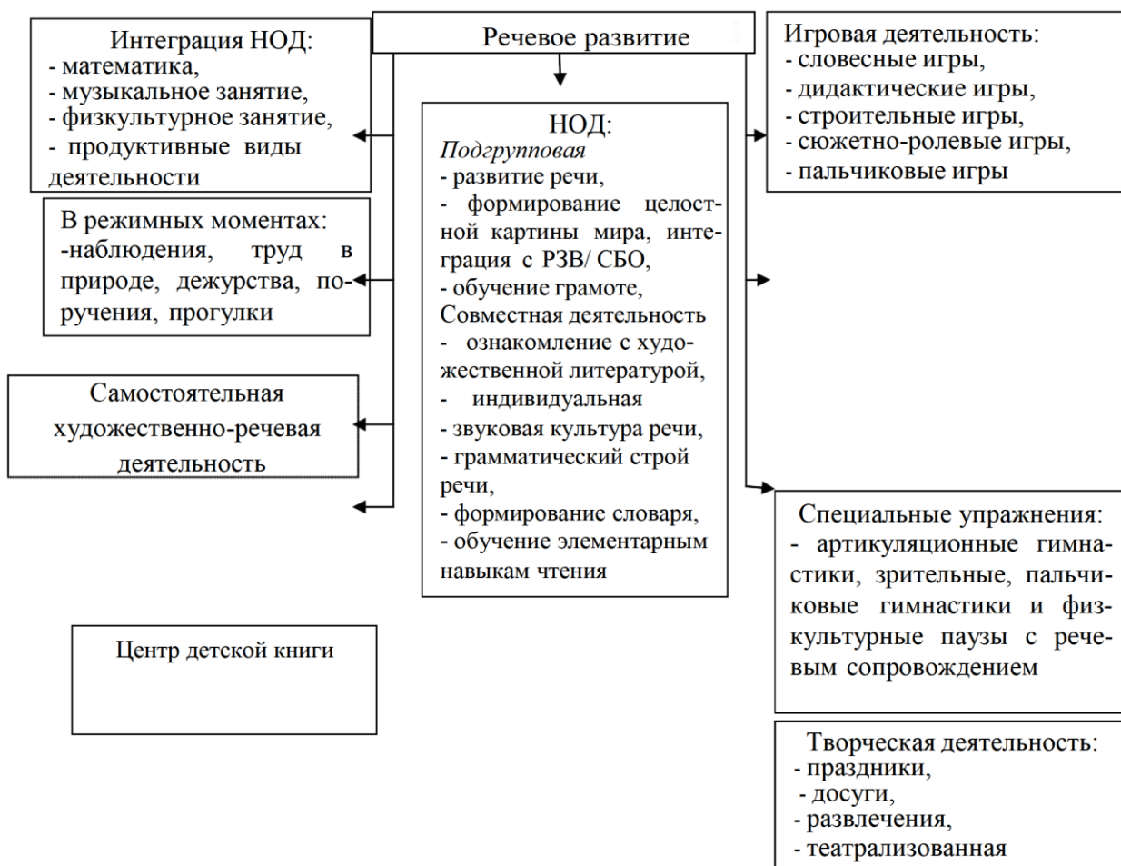
Схема организации работы в ДОО по речевому развитию:

Занятия по развитию речи в младших группах ориентируются на создание комфортной обстановки и потребности в эмоциональном общении детей с педагогом. Учитывая специфику данного возраста, программный материал по данному разделу реализуется педагогами в рамках сюжета сказки, путешествия, приключения, игры. Сюжетно-тематическая организация занятий и разнообразие в